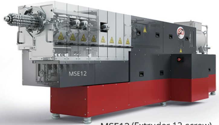
MSE12 (Extruder 12-screw)

结合 CPM 智能技术打造的 MSE12 系列，设计标准对标并超越行业严苛要求，是业内性能领先的标杆设备。